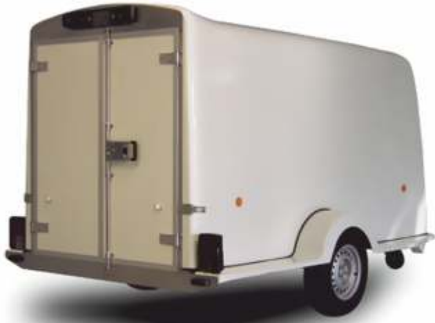
Rebel 1 Special