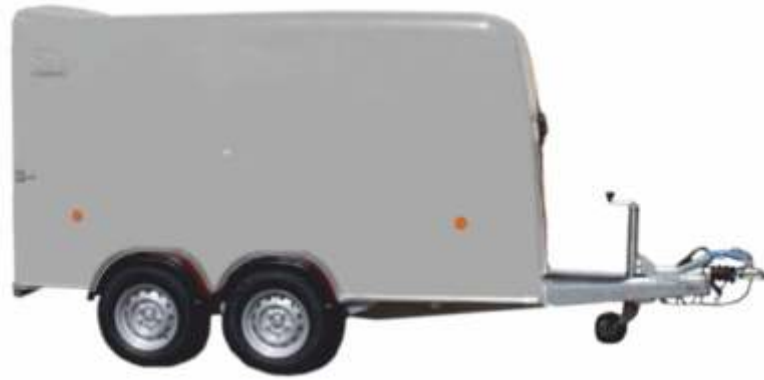
Rebel 2 Economic