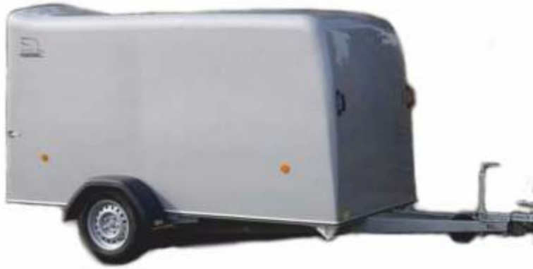
Rebel 1 Economic