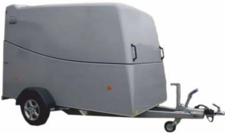
Rebel 3 E(inachsrig) Economic