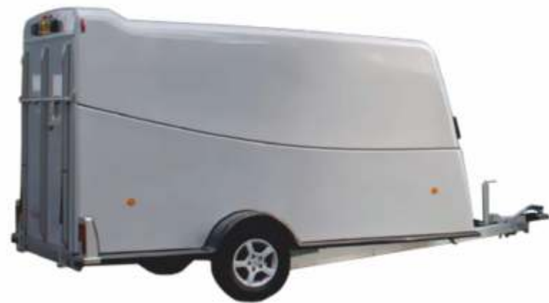
Rebel 3 E(inachsig) Special