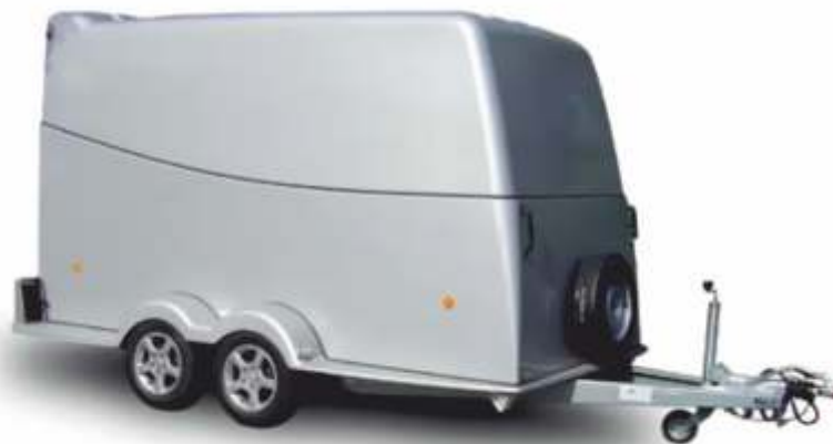
Rebel 4 Special