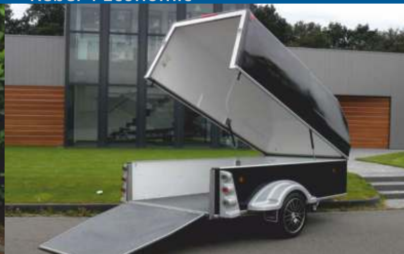
Rebel 1 Economic Toplift