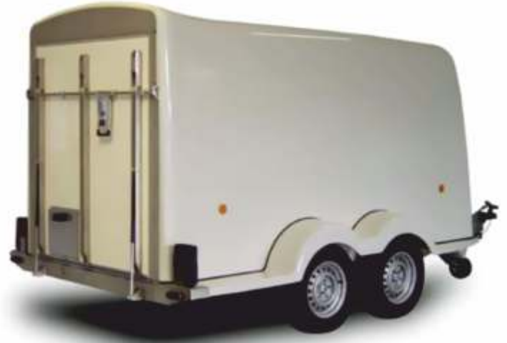
Rebel 2 Special