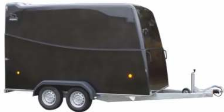
Rebel 4 Economic